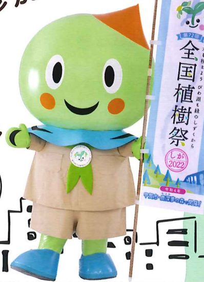
全国植樹祭しがPR大使 うおーたん