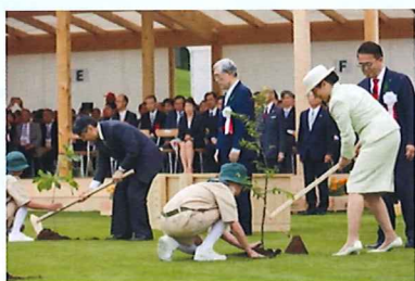
R1 愛知県大会の様子