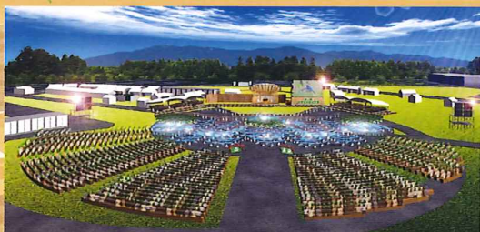
開催イメージ図（甲賀市「鹿深夢の森」）

豊かな国土の基盤である森林・緑に対する国民的理解を深めるために開催する国土緑化運動の中心的行事です。昭和25年（1950年）の第1回大会以来、例年春に各都道府県をまわり開催されており、滋賀県での開催は47年ぶりです。